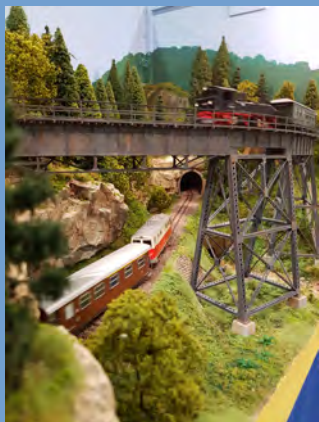
Allemagne – Raymond Duton