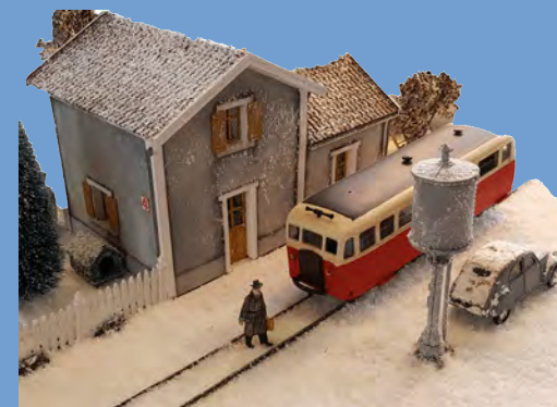
Diorama de Christophe Fortier