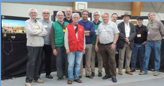
Rassemblement de modules en exposition

Le GEMME peut vous aider à réaliser simplement vos envies.