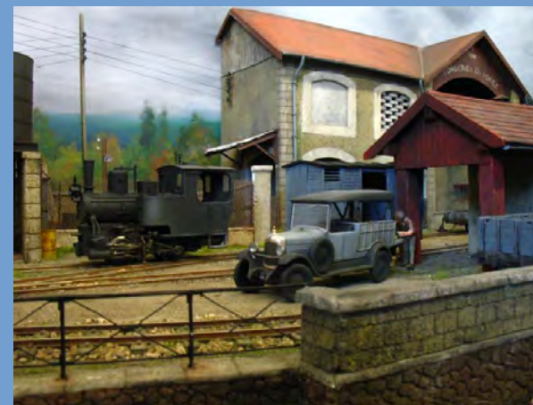
Module de Gérard Huck