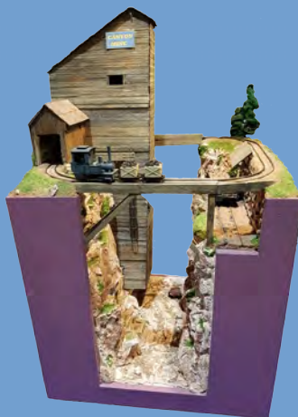
USA – Jean-Pierre Hacard