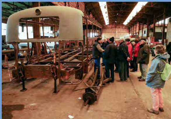
Visite au Musée des Chemins de Fer de l'Allier