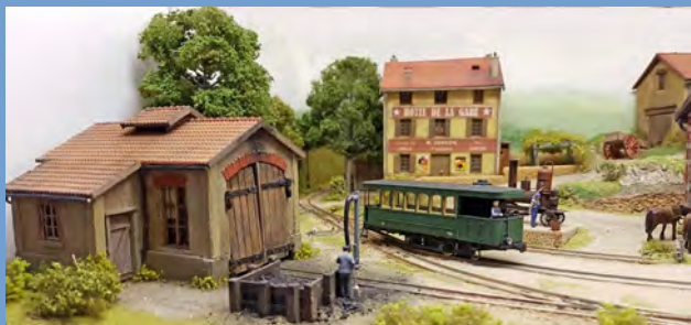
Tournenron sur l'Atable – mini réseau GEMME

Le GEMME édite un bulletin de liaison : “la Gazette des secondaires et des amateurs de voie étroite”.